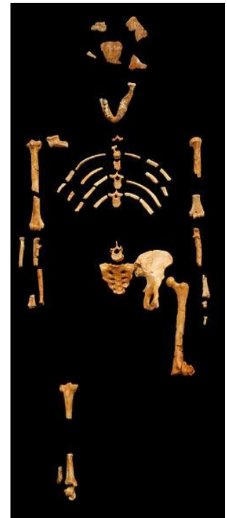
Bilde 2 Lucy

Andre ledende paleontologer bekrefter også at Lucys ganglag var betydelig forskjellig fra menneskers. R.Leakey og R.Lewin argumenterer at A. Afarensis og andre Australopithecus «nesten sikkert ikke var