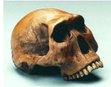
Bilde 4 Homo habilis-en samlegruppe Fra: http://hoopermuseum.earthsci.carleton.ca/emily/eighth.html

En analyse i Nature av ørekanalene til habilis fant at skallen er mest lik bavianer og foreslo at fossilet « støttet seg mindre til to-fots gange enn Australopithecus. 24 » Artikkelen konkluderte at fylogenetisk utgjorde hodeskallen til habilis en usannsynlig kandidat mellom Australopithecus og Homo erectus. 25 Likedan fant en artikkel i 'Journal of Human Evolution' at habilis-skjelettet var mer likt levende aper