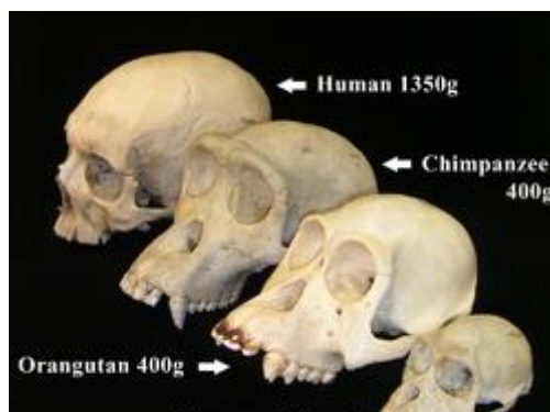
Bilde 3 ape- og menneske-skaller

Om mennesker utviklet seg fra ape-lignende vesener, hva var overgangs-formene mellom ape-lignende hominider og menneske medlemmer av Homo-arten, i fossil registeret? Mange paleontologer har trukket fram Homo habilis, datert til ca. 1.9 mill. år siden, som en overgang-sart. Men det er stor usikkerhet om hva arten homo-habilis egentlig besto av. I følge Ian Tattersall, antropolog ved American Museum of Natural History, var arten en